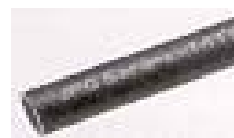
Coudes PU Coquilles PIR